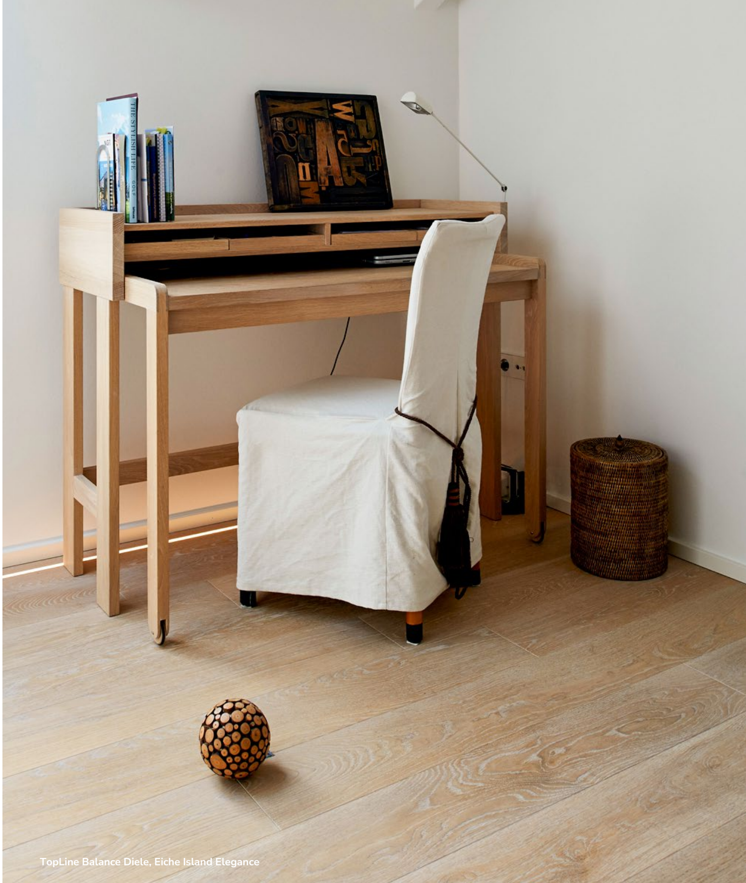
TopLine Balance Diele, Eiche Island Elegance